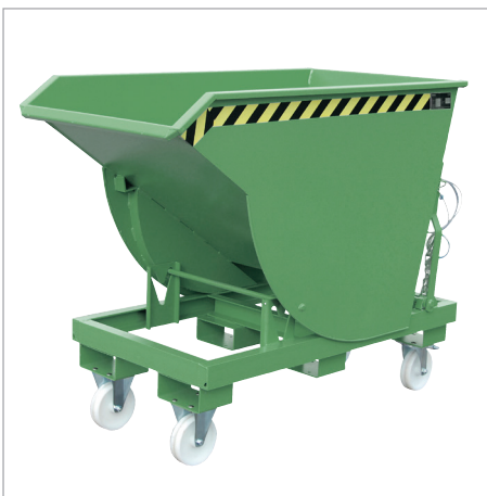
BKM à roulettes