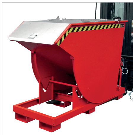
BKM avec couvercle